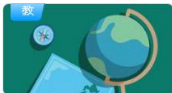
2020大学生安全教育-综合篇 超星安全教育